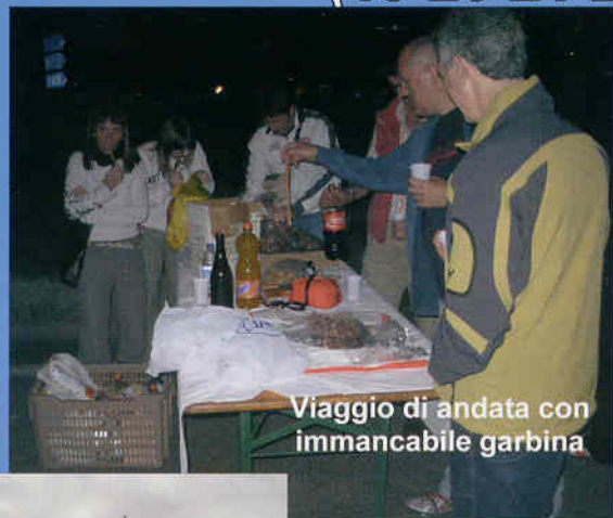
Viaggio di andata con immancabile garbina