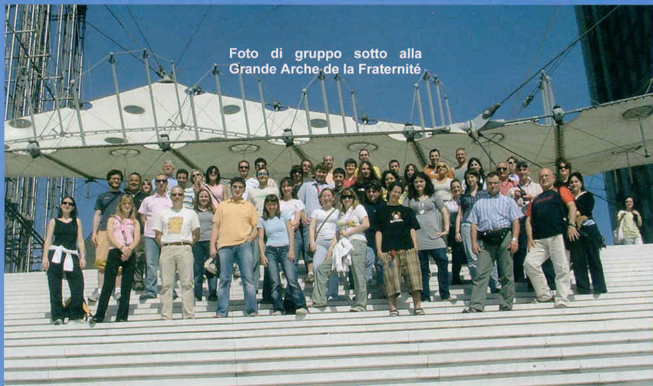
Foto di gruppo sotto alla Grande Arche de la Fraternité