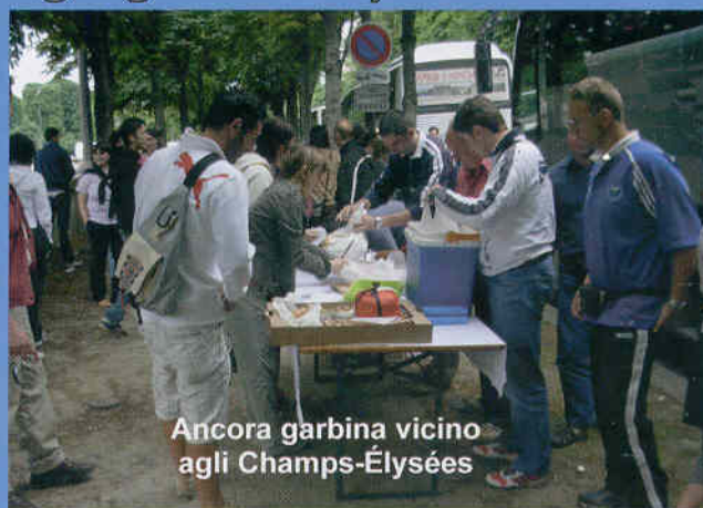
Ancora garbina vicino agli Champs-Élysées