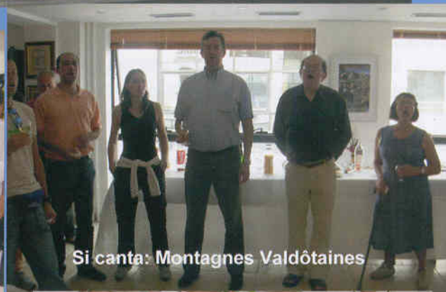
Si canta: Montagnes Valdôtaines