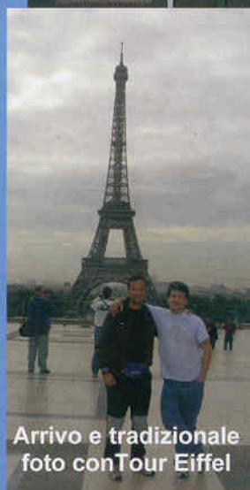
Arrivo e tradizionale foto con Tour Eiffel