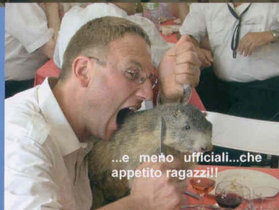
...e meno ufficiali...che appetito ragazzi!!