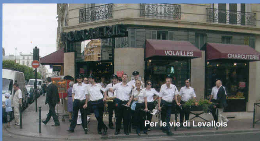
Per le vie di Levallois