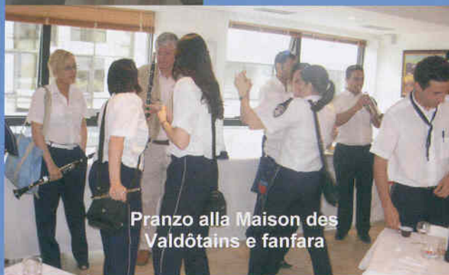
Pranzo alla Maison des Valdôtains e fanfara